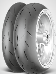
ContiRaceAttack 2 soft / medium