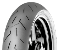
150/65 R 18